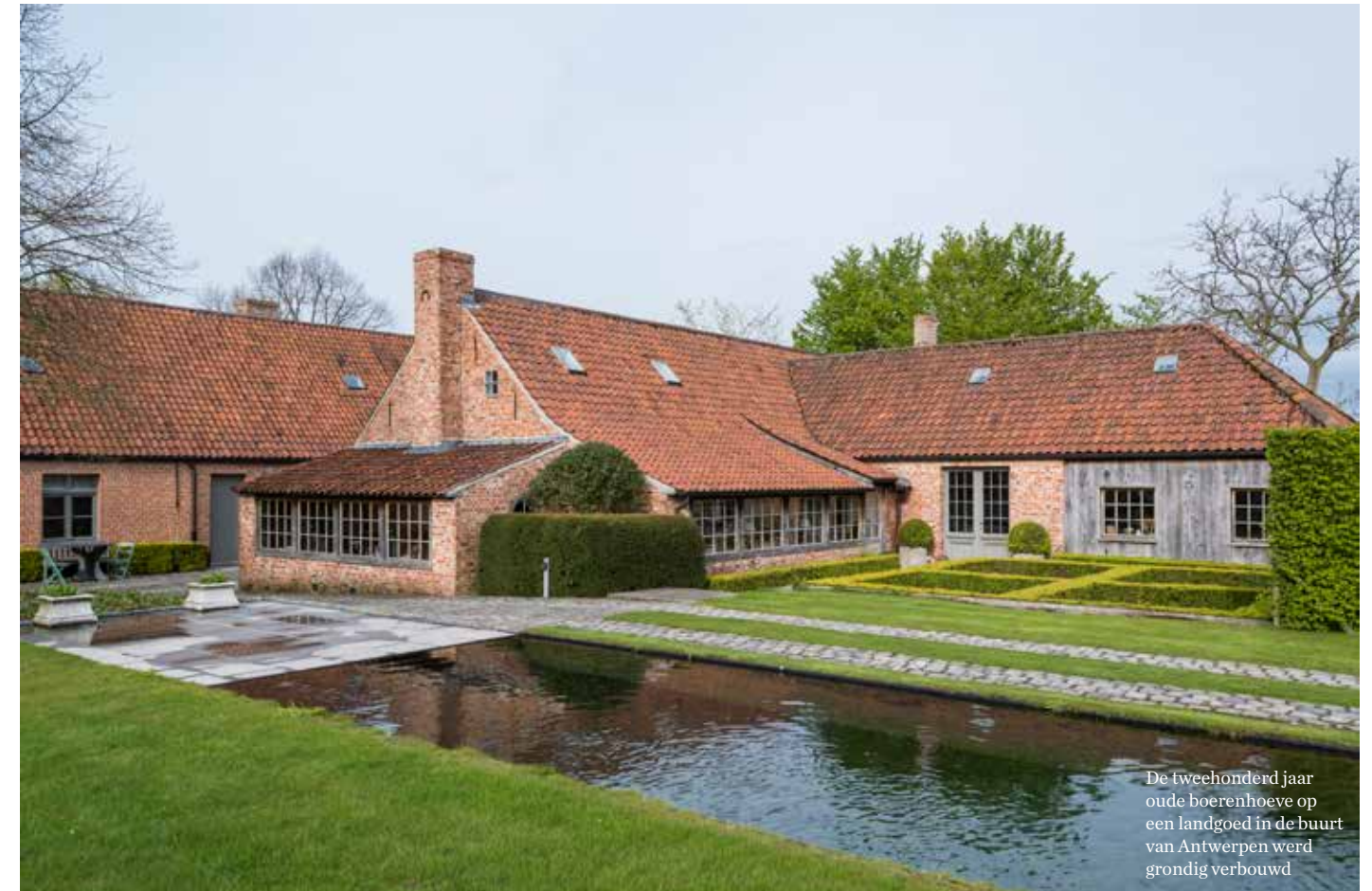
De tweehonderd jaar oude boerenhoeve op een landgoed in de buurt van Antwerpen werd grondig verbouwd