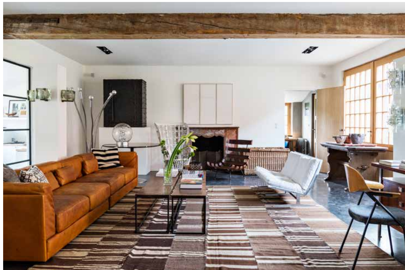
Boven Leren bank van de Sede uit de jaren zeventig, tegenover twee witte stoelen van Preben Fabricius. Aan de wand: wit kunstwerk van Renaat Ivens