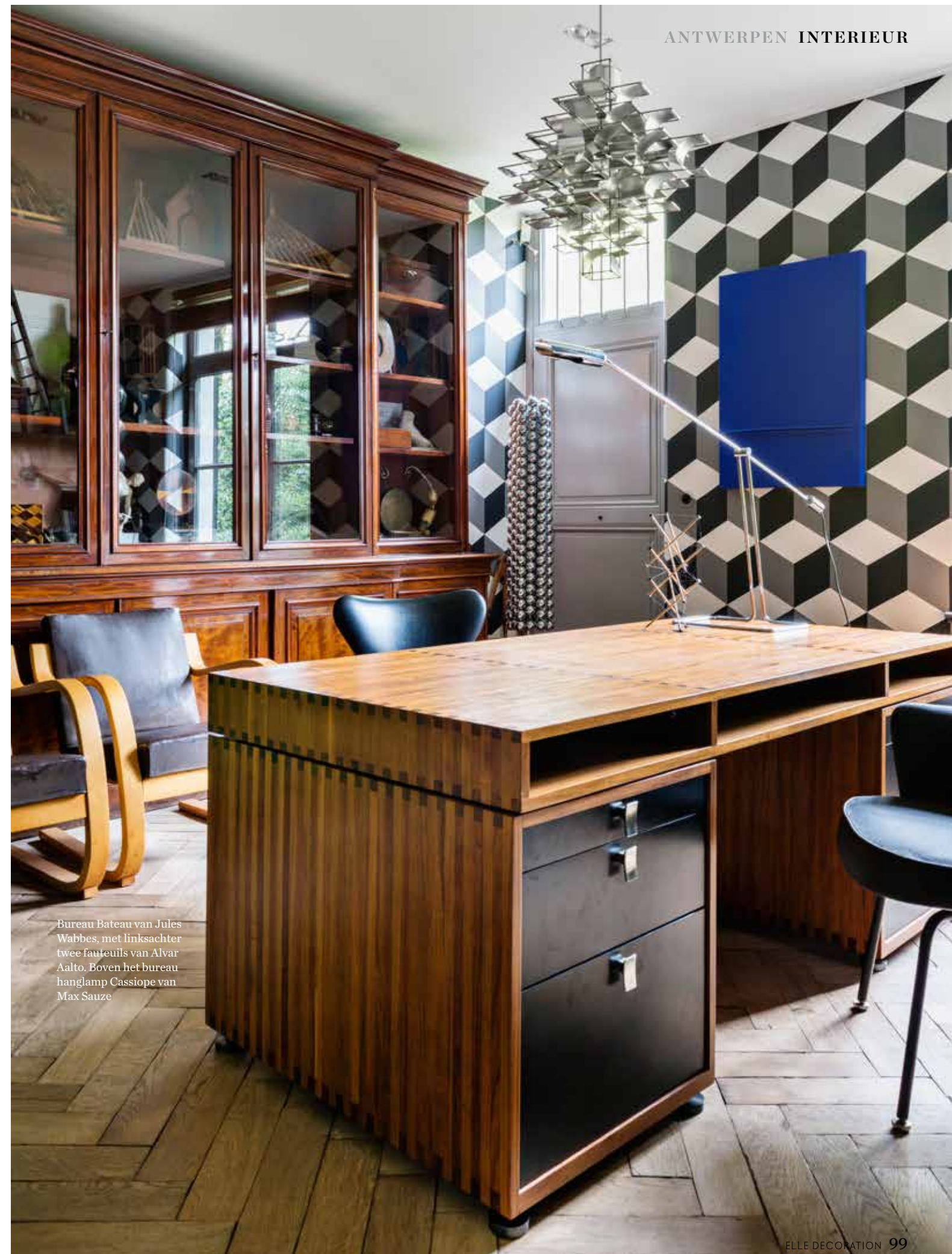
Bureau Bateau van Jules Wabbes, met linksachter twee fauteuils van Alvar Aalto. Boven het bureau hanglamp Cassiope van Max Sauze